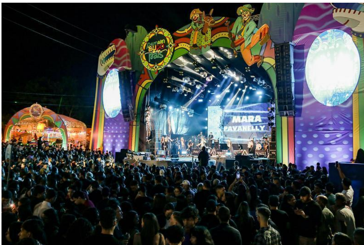
Imagem 10: Show no palco Pernambuco Meu País - Gravatá (2025).

O Festival Pernambuco Meu País (FPMP) é um dos projetos realizados pela FUNDARPE mais bem sucedidos e implementados desde o ano de 2024, que apresentou uma proposta de programação cultural itinerante, proporcionando a interligação de curadoria, formação e patrimônio através de uma programação diversa e pensada estrategicamente para cada município onde é realizado. Na sua programação foram incluídas as linguagens artísticas nos segmentos da Música, Cultura Popular, Audiovisual, Artes Visuais, Artes Urbanas/Artes Periféricas, Artesanato, Circo, Dança, Fotografia, Literatura, Design e Moda, Teatro, Patrimônio e Gastronomia, além de proporcionar uma programação especial e inédita voltada para o público infantil.