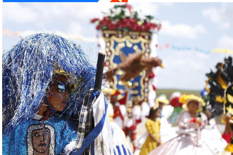
Imagens 1 e 2: Card de divulgação da Convocatória CAJU 2026 e Maracatu Leão do Norte, em Aliança-PE, no Ciclo Carnavalesco.