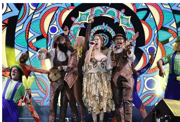
Imagem 13: Espetáculo Pernambuco Meu País,