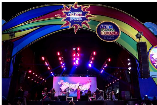
Imagem 14: FPMP Verão-Camaragibe (2025).

Cultura (SECULT-PE), FUNDARPE e EMPETUR, programou uma edição inédita do Festival Pernambuco Meu País - Verão (2025/2026), com o alcance de cidades localizadas na Região Metropolitana do Recife e Zona da Mata; reforçando o festival como um importante motor de desenvolvimento econômico, cultural e social em Pernambuco, assim como democratizando o acesso à cultura.