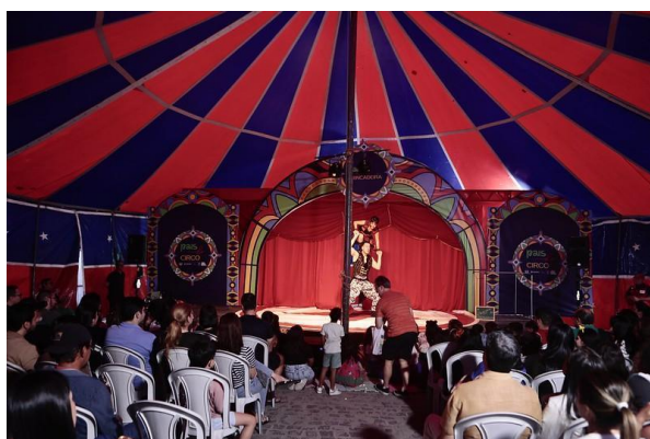
Imagem 12: Espetáculo Acroshow,

Foram mais de mil contratações artísticas em 45 dias de programação, envolvendo apresentações, shows, espetáculos, cortejos e atividades educativas, valorizando principalmente a produção cultural do Estado. Cerca de 87% das atrações foram de artistas pernambucanos, abrangendo músicos, atores, dançarinos, brincantes, artesãos, designers, fotógrafos, escritores e empreendedores criativos. A programação contemplou 12 (doze) linguagens artísticas, entre elas: música, dança, teatro, circo, audiovisual, literatura e gastronomia, distribuídas em mais de 20 (vinte) pólos, como o Palco Pernambuco Meu País, os espaços descentralizados, cortejos populares e as atividades formativas, totalizando mais de 7.800 artistas participando do festival.