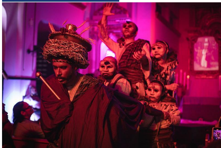
Imagens 3 e 4: Card de divulgação do Edital do 17º Pernambuco de Todas as Paixões 2026 e registro do “Auto da Via Dolorosa”, realizado em Timbaúba-PE, 2024.