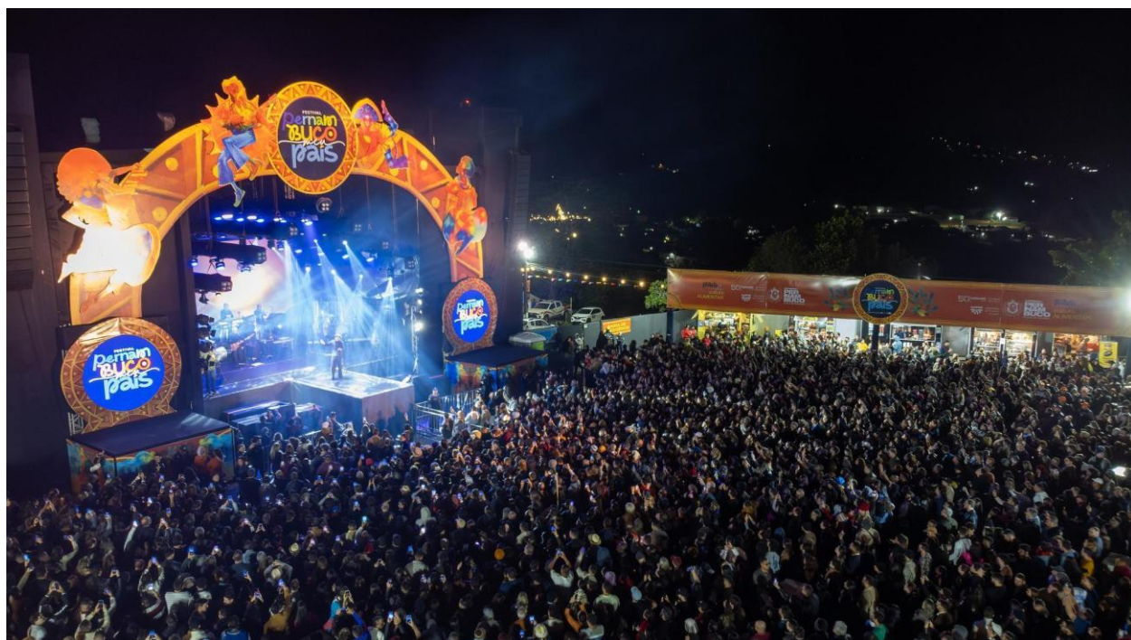
Imagem 11: Show Jorge Vercilo, Julho 2024.

Na primeira edição do Pernambuco Meu País, 80% de sua programação foi composta por artistas pernambucanos, tendo sido investidos R$ 30,5 milhões pelo Governo de Pernambuco na sua realização (sendo 14,1 milhões em contratações artísticas); por meio da FUNDARPE, Secretaria Estadual de Cultura (SECULT-PE) e Empresa Pernambucana de Turismo (EMPETUR), movimentando 93% da rede hoteleira em 24 dias de festival.