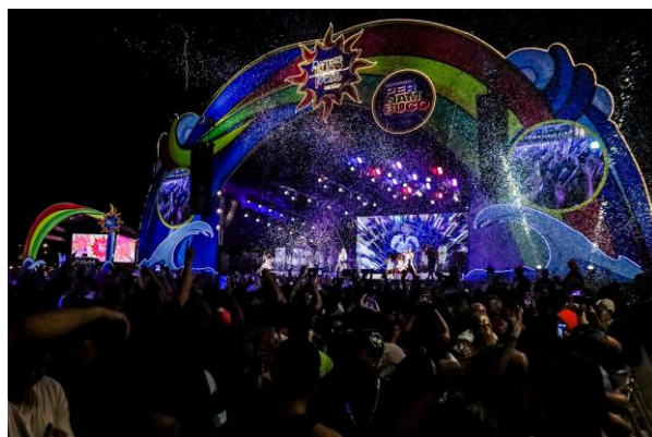
Imagem 15: FPMP Verão-Recife (2025).