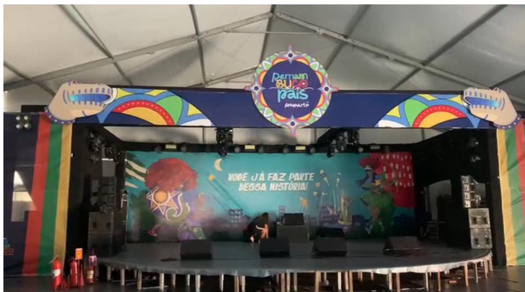
Imagem 7: Montagem do Palco Pernambuco Meu País.

A atuação direta da FUNDARPE tem foco nas contratações artísticas e nas demais contratações necessárias para a produção das referidas apresentações artístico-culturais. Na sua última edição, o Palco Pernambuco Meu País apresentou 78 atrações musicais, indo da cultura popular à artistas da nova cena pernambucana, contribuindo com a atração de público para a FENEARTE.